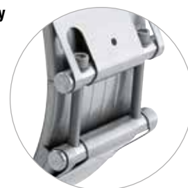
Złączka rurowa NORMACONNECT® FLEX 3 z opaską o wyjątkowo dużej szerokości 211 mm