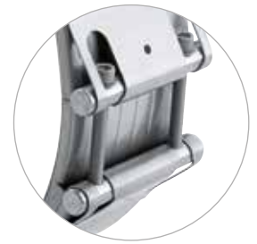
NORMACONNECT® FLEX 3 csőkapcsoló szerkezet extra széles, 211 mm-es házzal