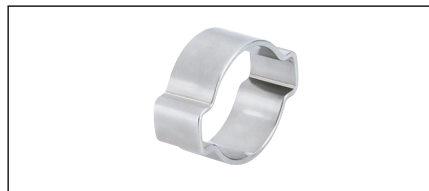
Collier à deux oreilles